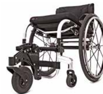
Roue avant tout terrain FrontWheel. Liberté maximale et facilité de propulsion quel que soit le terrain. Compacte, très simple à installer. Compatible avec Tiga, Tiga FX et Hi Lite.