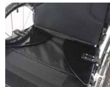
Protège-vêtements rabattables sur l'assise.