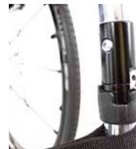
Système de pliage Q-lock du châssis avant.