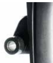
Plaque d'axe légère