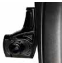
Plaque d'axe standard

La plaque d'axe standard (RCG: 2 - 12 cm) permet un réglage aisé du centre de gravité, tandis que la plaque d'axe légère (RCG: 5 - 12 cm) peut être montée inversée pour obtenir plus de positions de hauteur d'assise.