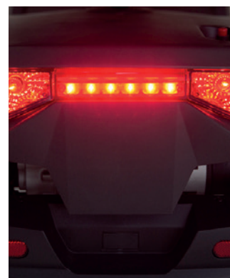
Feux de stop

S'allument automatiquement, lors de la décélération et le freinage.