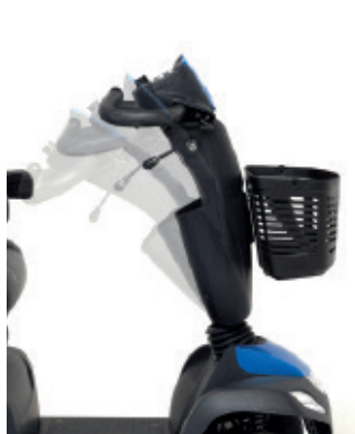
Réglage de la colonne de direction

Les utilisateurs peuvent facilement régler la colonne de direction en angle grâce au levier.