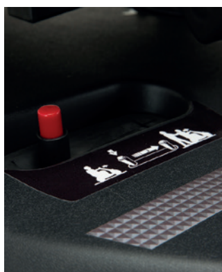
Levier de débrayage en deux étapes

S'allument automatiquement, lors de la décélération et le freinage.