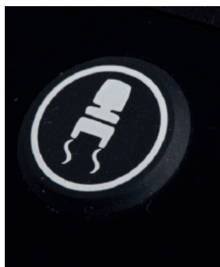
Réducteur de la vitesse automatique

Ce levier empêche le scooter de partir accidentellement en roue libre.