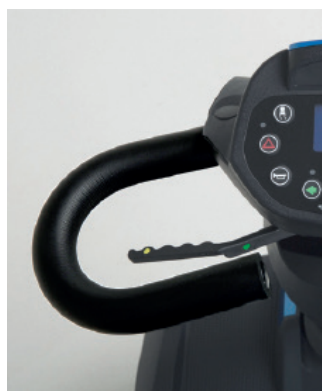
Poignées de direction ergonomiques

Les utilisateurs peuvent facilement régler la colonne de direction en angle grâce au levier.