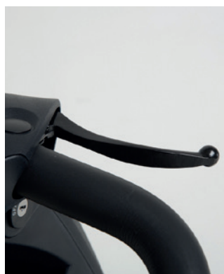
Frein à main

offre une conduite confortable avec une bonne traction et une bonne stabilité.