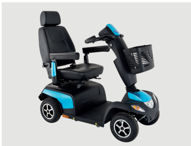
Orion METRO 4 roues