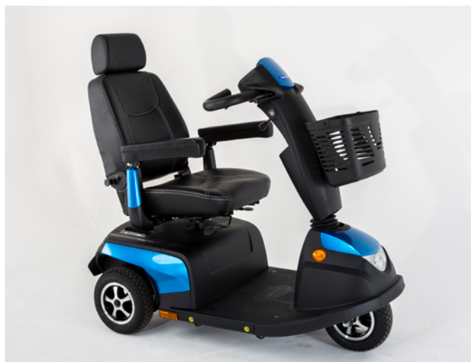
Orion METRO 3 roues