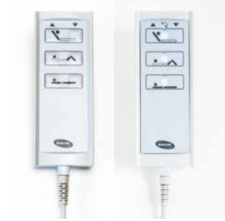
Handbediening met of zonder vergrendeling / Télécommande avec ou sans verrouillage