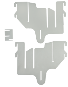
Transportkit / Kit de transport Vlotte opslag, makkelijk te transporteren. Pour transport et stockage faciles.