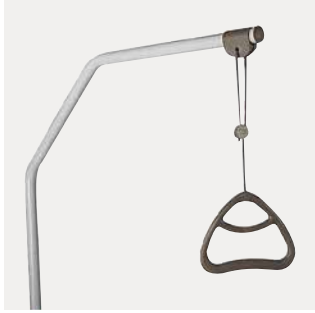
Optreksysteem / Potence de lit