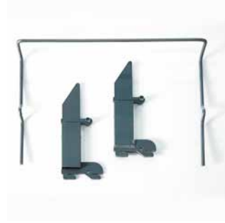
Verlenging inlegraam met 15 cm / Extension plan de couchage de 15 cm