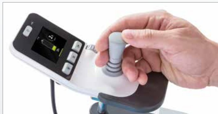
Écran couleur d'informations et éléments de commande conviviaux