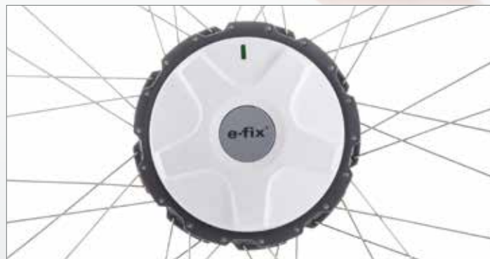
Motorisation compacte, légère, et puissante