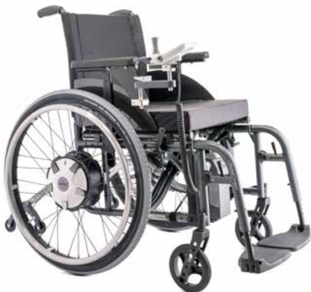
e-fix E36: Roues motrices plus puissantes que la version E35